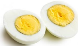
jajka ugotowane na twardo