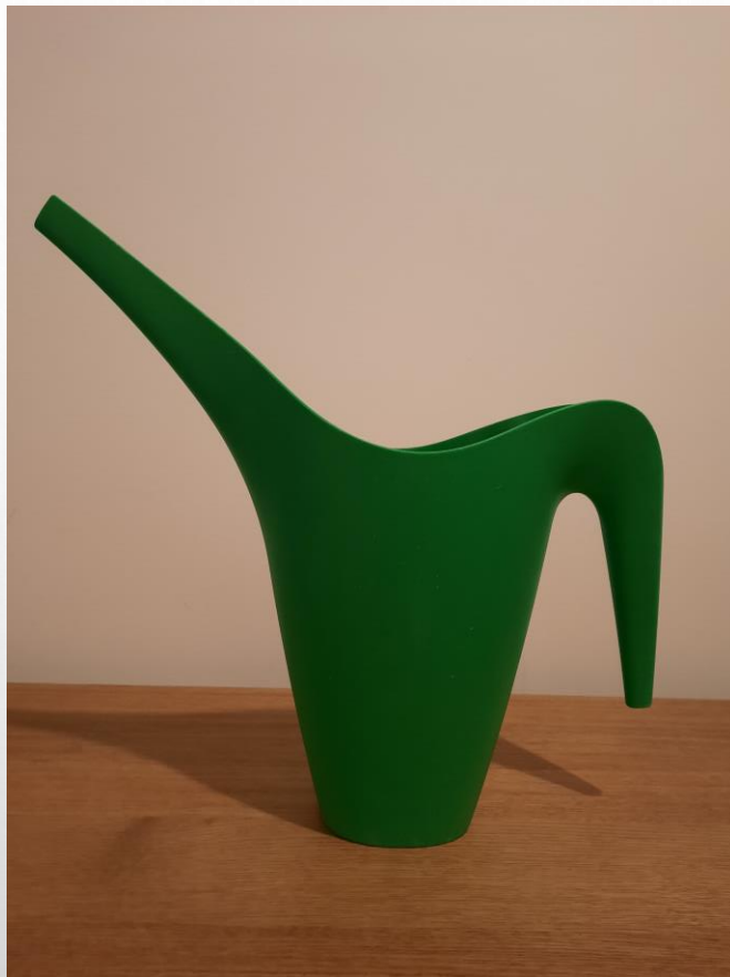
konewkę z wodą