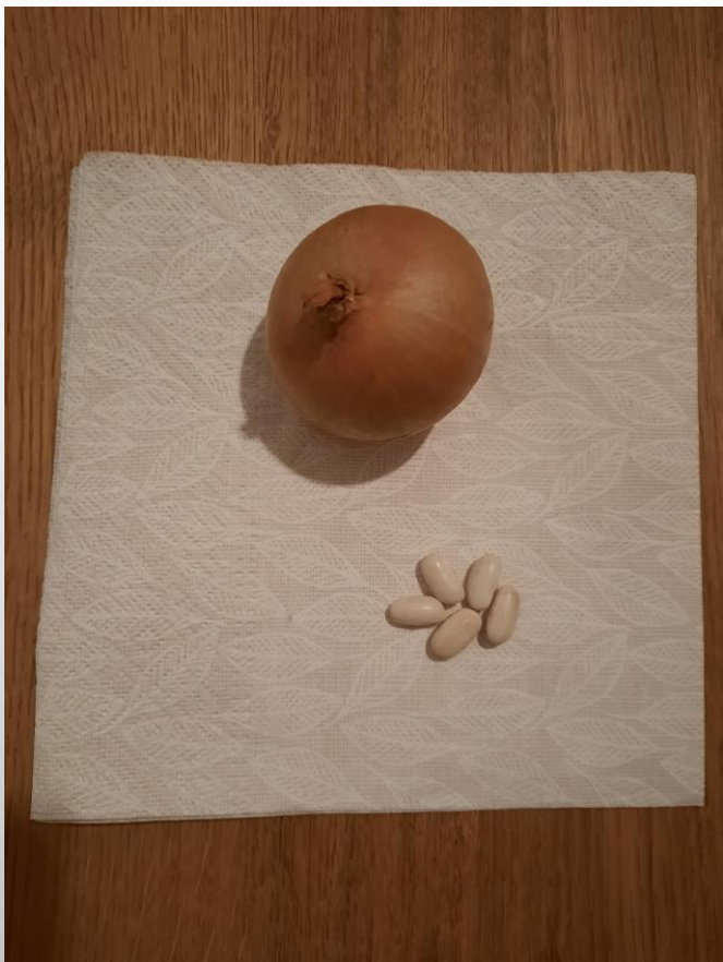
cebulę lub fasolę