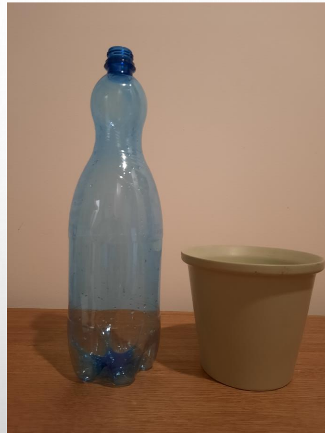
butelkę lub doniczkę