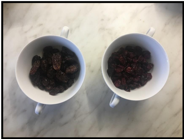
▶ Rodzynki, żurawina